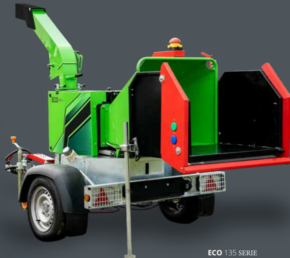
ECO 135 SERIE